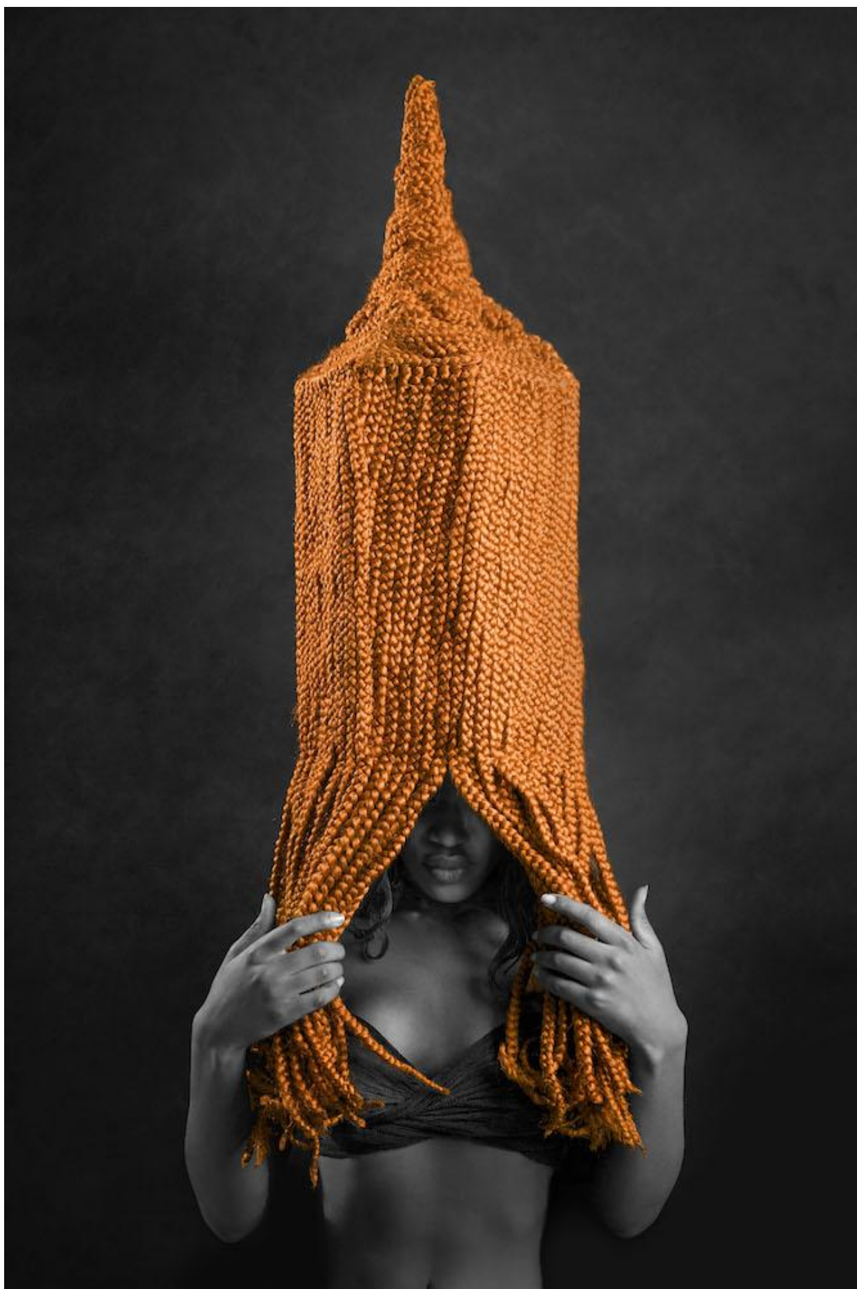
Meschac Gaba, Blaaktoren (The Pencil), 2016, Braided wig of synthetic hair, 60 x 25 x 25 cm. Courtesy the artist and Pippy Houldsworth Gallery, London.