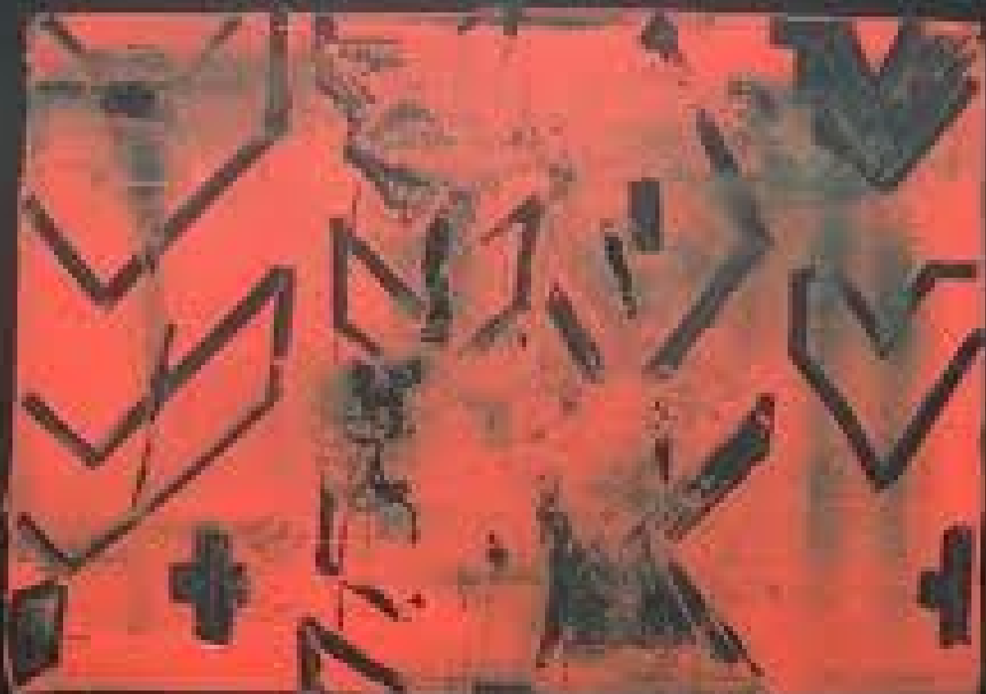
Arissana Pataxó - S/ título (série grafismos pataxó) - 2008