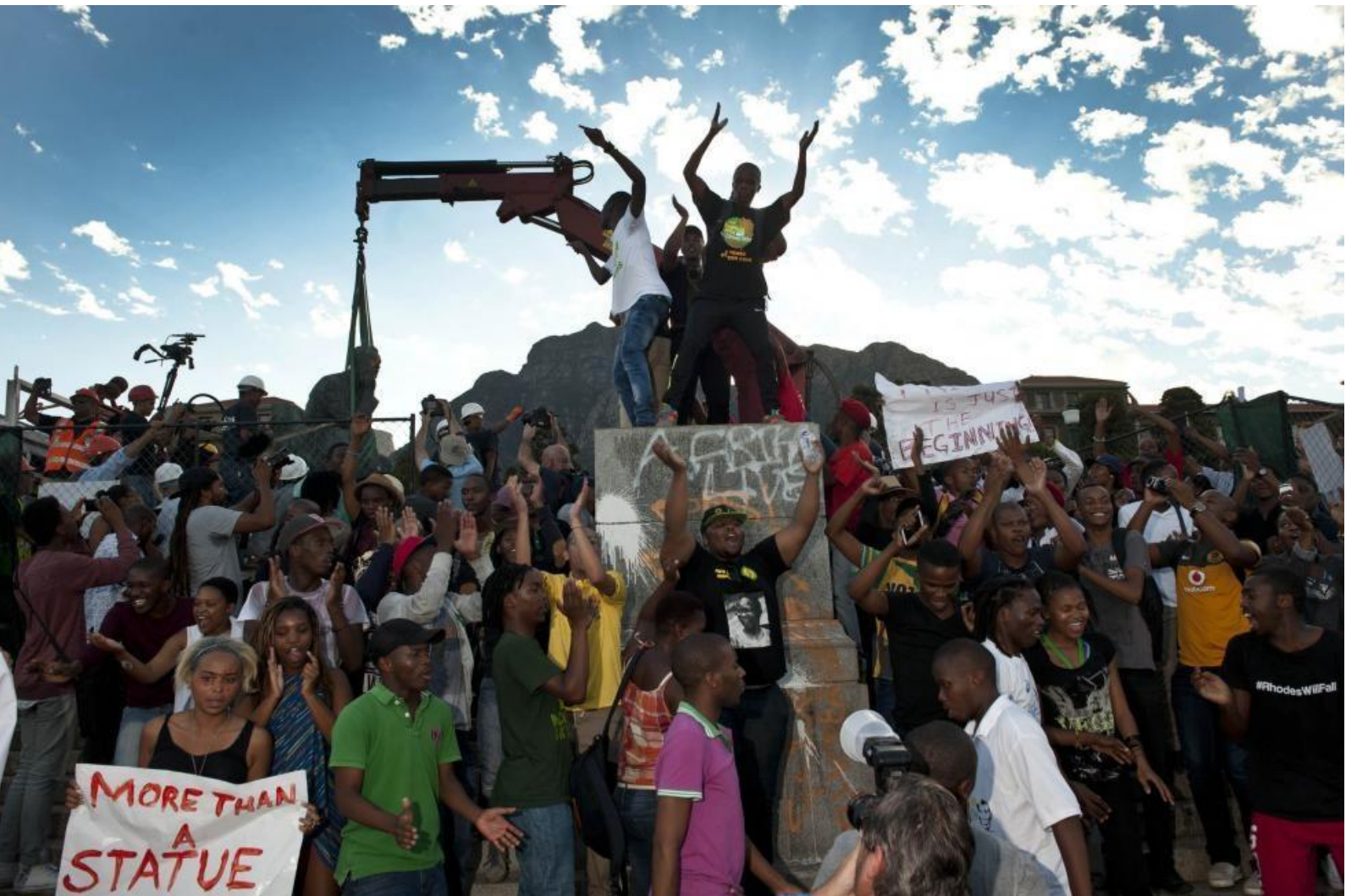
Rhodes Must Fall - South Africa - Students celebrate as Rhodes statue is being taken down.

ppgcom/ufmg luciana de oliveira 60 h/a - 2021_1